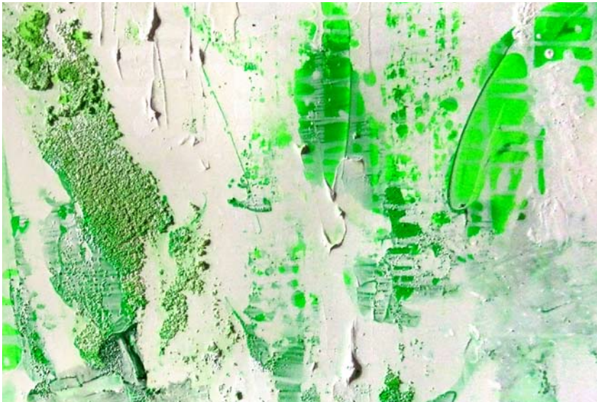
Détail d'un des tableaux présentés lors de l'exposition de Bruxelles.

Explication « J'avais envie de jouer sur le thème du paraître. »